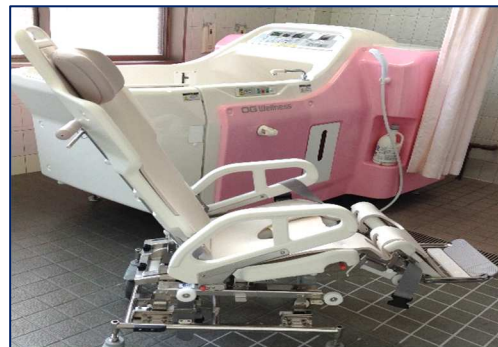
福久ケア温泉について